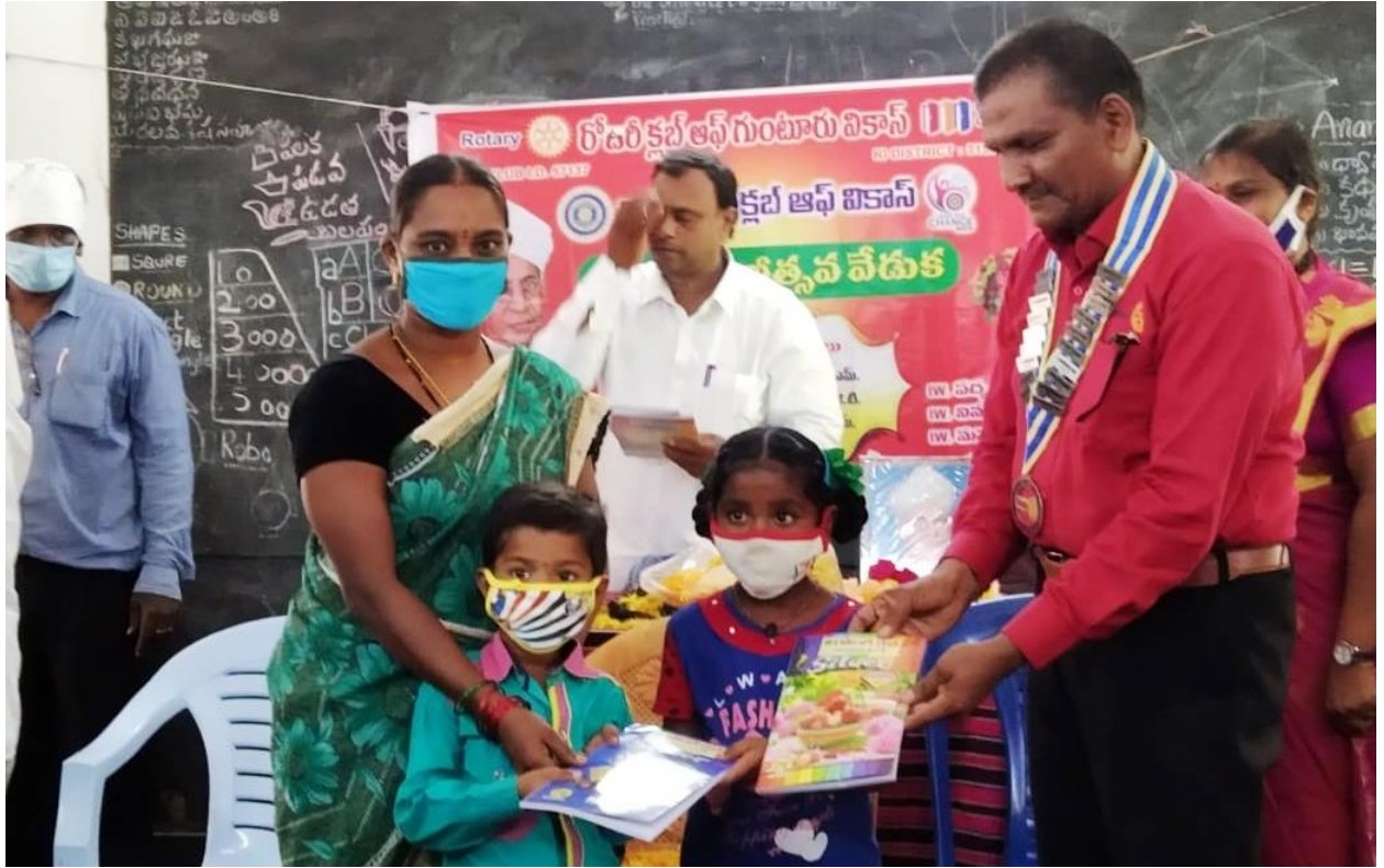
On Teachers Day note books were distributed to students of Kottur village.