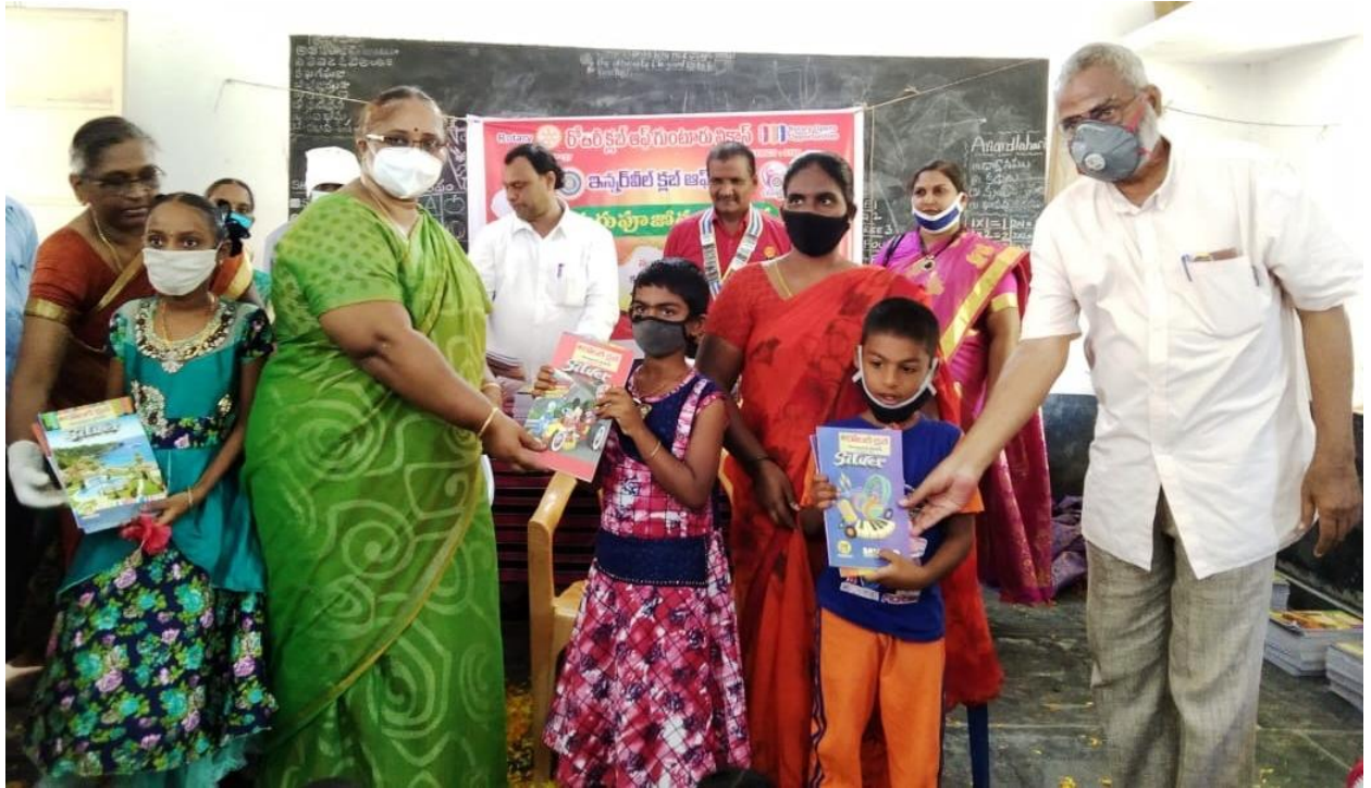
On Teachers Day note books were distributed to students of Kottur village.