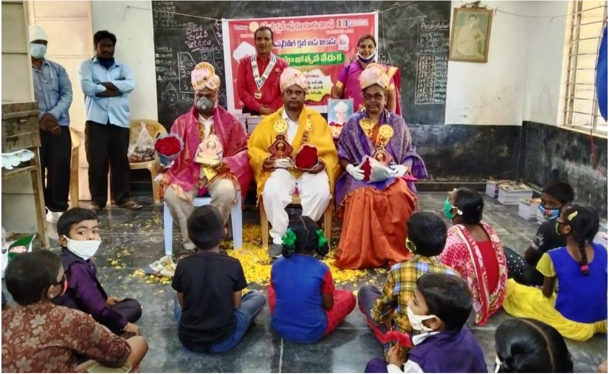
Felicitations to 3 best teachers on Teachers Day at Kottur village on 5th September, 2020